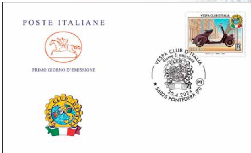
(Frans Haverschmidt – 240425)

Als je het over Vespa hebt, verwijst het naar een buitengewone wereldwijde ambassadeur van het Italiaanse talent om schoonheid te creëren. Deze serie, uitgegeven door de filatelistische en numismatische afdeling van de posteries van San Marino, is gemaakt door de ontwerper Paola Momentè, die haar werk als volgt uitlegt: "Vespa gaat niet alleen over rijden, het gaat ook over samen rijden. Alle individuele passie voor tweewielers verandert in een collectieve ervaring bij de Vespa Club, nu maar liefst 75 jaar geleden". De postzegel illustreert links een jonge man met een rode helm op een rode Vespa op een witte weg naast een jonge vrouw met een gele helm op een gele Vespa, tegen een lichtblauwe achtergrond. De plaat van de rode Vespa draagt het nummer 20.04 en de plaat van de gele Vespa het nummer 2024, om de uitgiftedatum van de postserie te benadrukken. De strook links op het vel met de waarde van € 1,25 toont een vergroting van dezelfde afbeelding als de postzegel met het opschrift "VESPA CLUB D'ITALIA – Emissione congiunta San Marino – Italia".